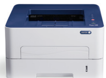
Phaser 3260. Impression