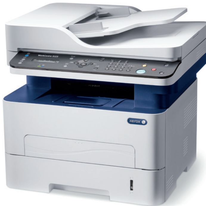
WorkCentre 3225. Copie. Impression. Numérisation. Télécopie. Courrier électronique.