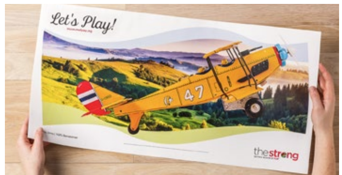
Impression sur feuille extra longue - dimensions de papier maximales 330 x 660 mm

Cet outil permet d'obtenir de meilleures marges, des profits plus généreux, et la possibilité de vous développer stratégiquement grâce à un investissement d'avenir simple.